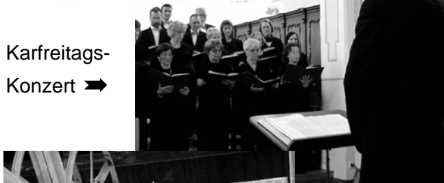
Karfreitags- Konzert ➔