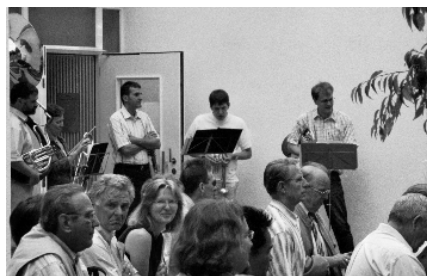
→ Kirchenmusik: z.B. Posaunenchor