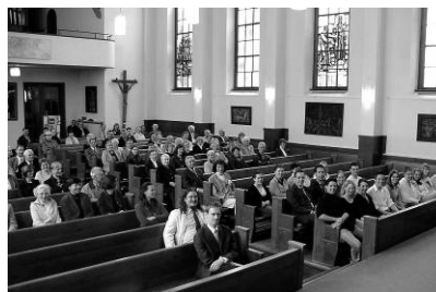
← Gottesdienst Christuskirche