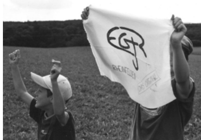
← Kinder- und Jugendarbeit: z.B. Zeltlager